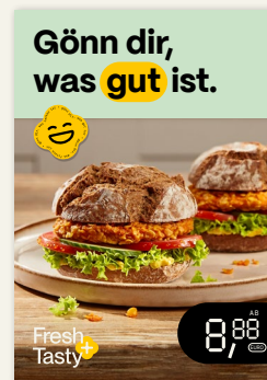
Plakate A1, A4, A3 quer und Digital Signature